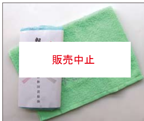
No. 15 リスマーク入りカラータオル (黄・青・緑)