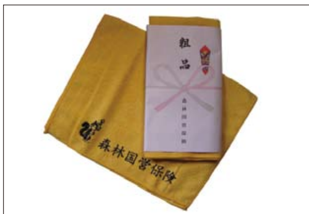
No. 14 マイクロファイバータオル (黄・青・ピンク)