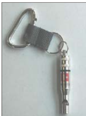
No. 7 IDホイッスル