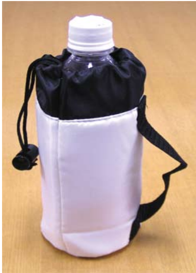
No. 9 ペットボトルホルダー