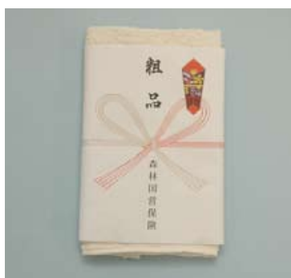
No. 13 エコハンドタオル