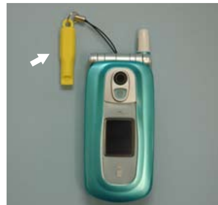
No. 6 ミニホイッスル