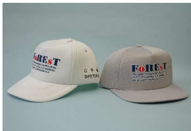
No. 16 帽子 (マーク付/白・灰)