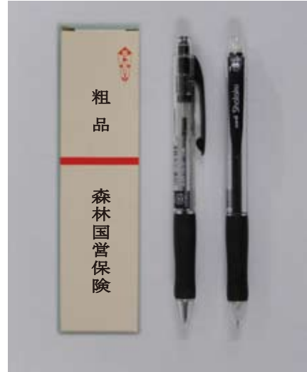
No. 5 エコペンセット