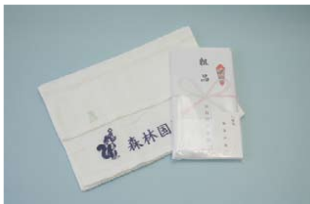
No. 12 エコタオル