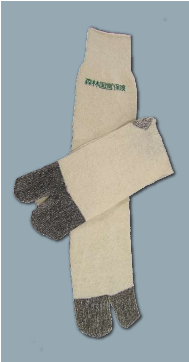
No. 4 作業用靴下