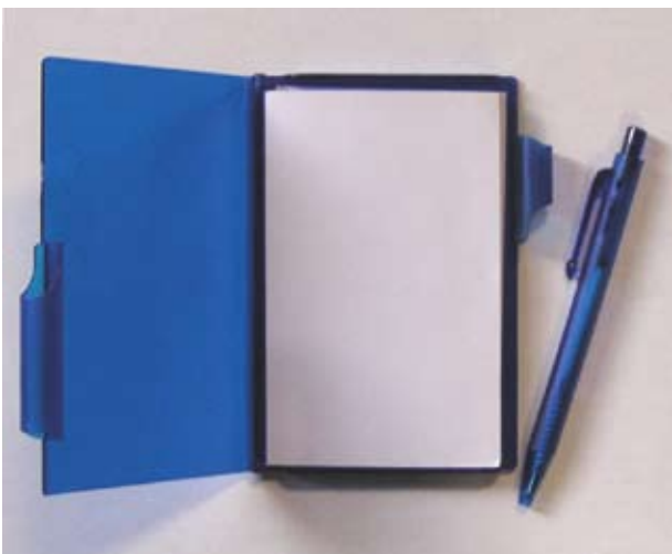
No. 10 メモ&ペン