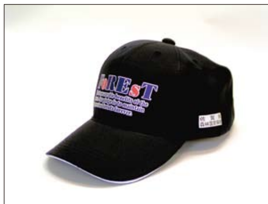
No. 17 エコキャップ (マーク付/紺)