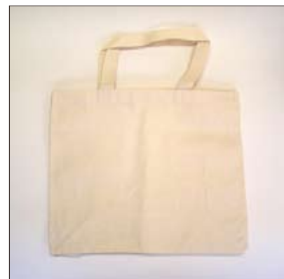
No. 8 トートバック