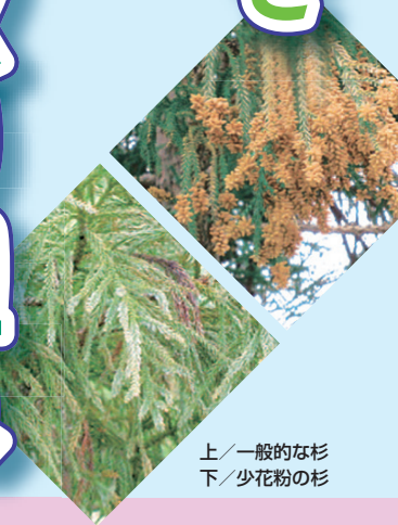
上/一般的な杉 下/少花粉の杉

花粉症のない健やかな社会を目指して スギ・ヒノキ花粉削減の取り組み 森林・林業における