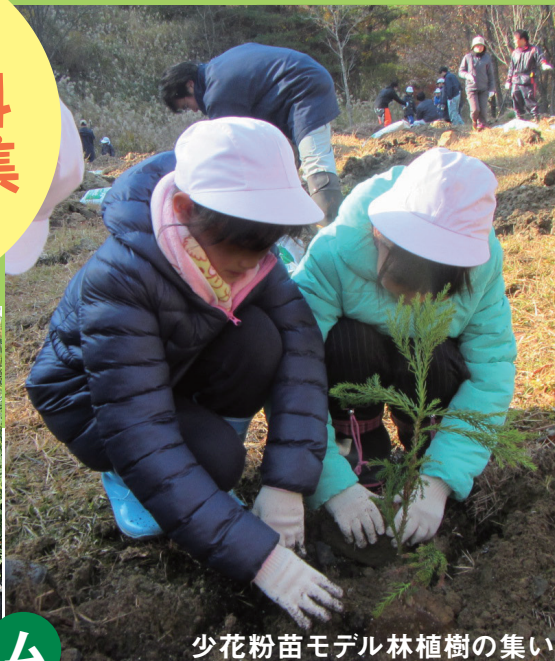
少花粉苗モデル林植樹の集い