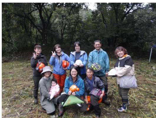
林業現場での安全作業や木の見分け方、道具の話、林業女子に対する思い、意見交換会を実施