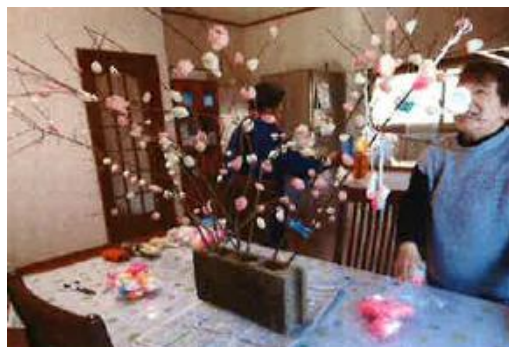
桜の花が咲いたみたいです