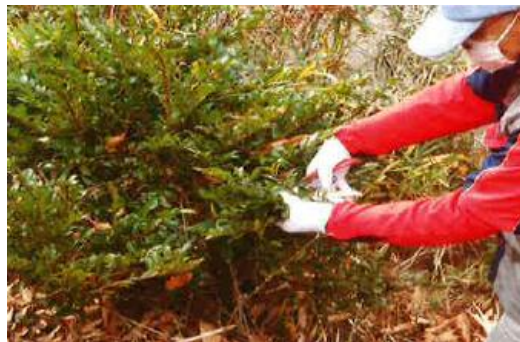
正月飾りの素材を山で採取