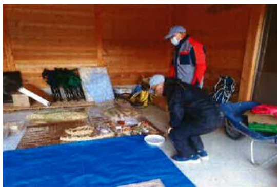
正月飾りづくりの準備